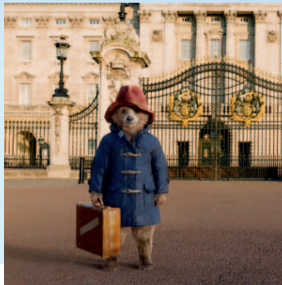
Filmstill aus »Paddington«