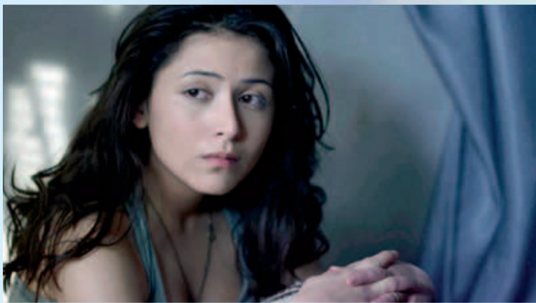
Filmstill aus »Ladder to Damascus«

Dem renommierten syrischen Filmemacher Mohamad Malas ist ein Film gelungen, der ohne Gewaltszenen die ganze Tragik der syrischen Situation zeigt. Inzwischen darf er Syrien nicht mehr verlassen, sein Film geht dennoch um die Welt. Die Filme des Koki sind für Geflüchtete kostenfrei.