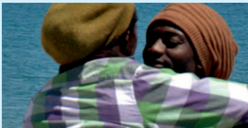
Filmstill aus »Life – Saaraba – Illegal«